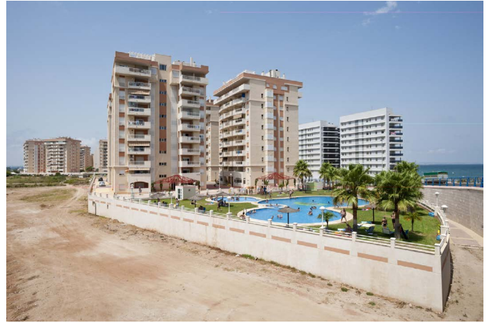
Nick Hannes, uit de serie 'Mediterranean. The Continuity of Man', 2010. Locatie: La Manga del Mar Menor, Spanje.