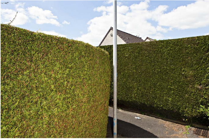
Lars Tunbjörk, uit de serie 'Every Day', 2012. Locatie: Beauvais, Frankrijk.